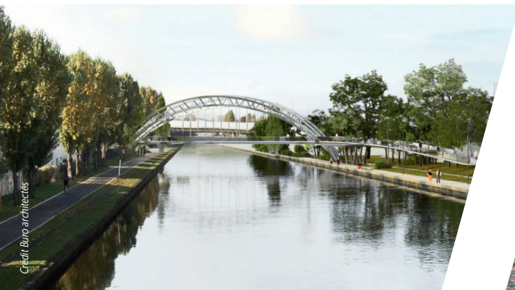
Les berges de l'Ourcq requalifiées

Une offre de locaux d'activités sera reconstituée à l'ouest du quartier, ou le long du canal à une échelle intercommunale pour relocaliser certaines entreprises du site et favoriser l'implantation de jeunes entreprises innovantes. Il est prévu de nombreux locaux d'activités et de commerces faisant du quartier des Rives de l'Ourcq une nouvelle polarité au sein de la ville .