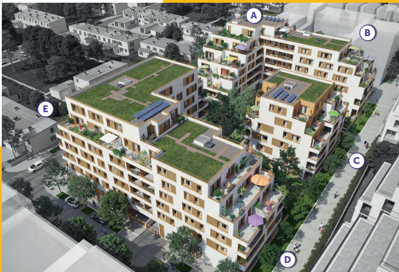
› Vue aérienne - Repérage des bâtiments