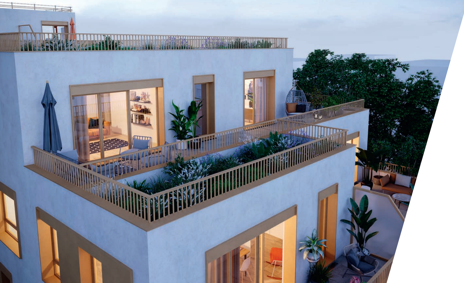
› Vue nocturne sur la résidence