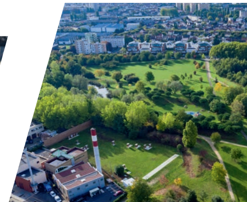
Bois de Bondy