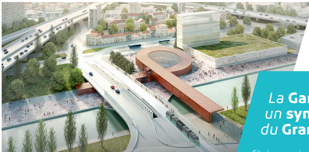
› La future gare Pont de Bondy

Le futur métro va permettre de décongestionner les principales lignes de transports en commun existantes grâce à la création d'une offre nouvelle en rocade ; de réduire la pollution automobile, de soutenir le développement économique de la région Ile de France en mettant en relation les grands pôles d'emploi et les bassins de vie, de désenclaver les secteurs les moins bien desservis en facilitant l'accès aux grands équipements, aux lieux de loisirs et aux lieux d'études de la région.