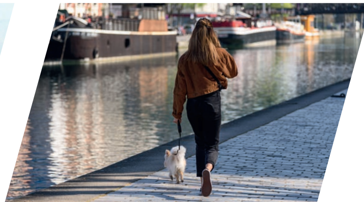
Promenade sur les bords du canal